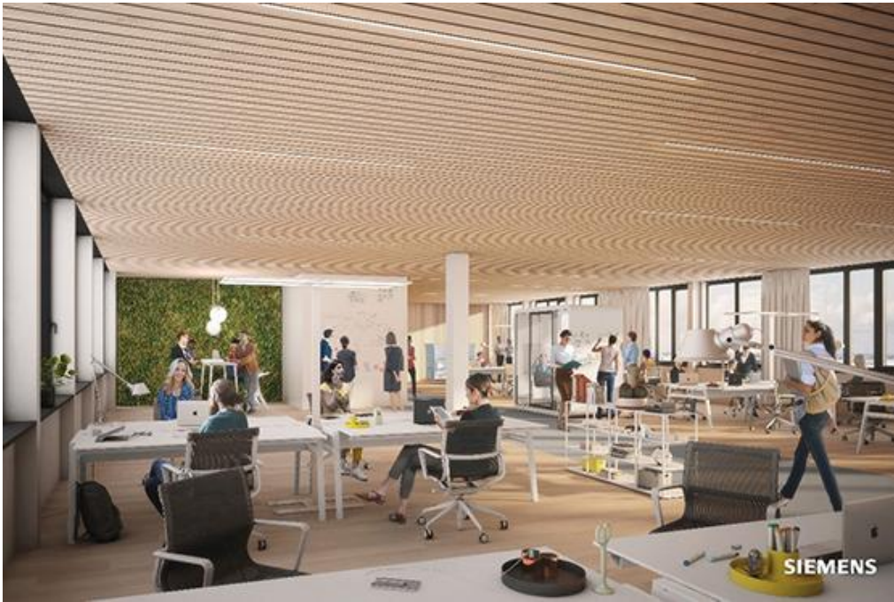
Beispielhafte Open Space Bürofläche im "The Move"

Es tut sich viel in Gateway Gardens. Auch die Baustelle des Büro-Komplex „The Move“ läuft auf Hochtouren und die beiden Gebäude nehmen Formen an. Die ersten Meilensteine sind bereits erreicht: „The Move Orange“ ist im Hochbau fertiggestellt. Seit Ende 2021 wird der Innenausbau vorangetrieben und im Dezember 2022 abgeschlossen werden. „The Move Blue“ befindet sich ebenfalls im Hochbau und wird voraussichtlich im Frühjahr 2023 fertiggestellt sein.