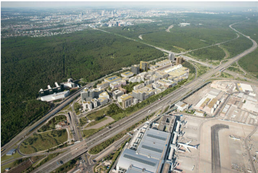
Gateway Gardens mit Blick Richtung Frankfurt City

Neun Mietvertragsabschlüsse seit Anfang 2021 – über 27.000 Quadratmeter Bürofläche neu vermietet